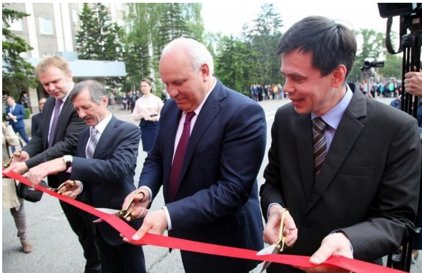
Мастер-класс «Дорожные ловушки» на открытии Республиканского детского технопарка «Кванториум «Хакасия»