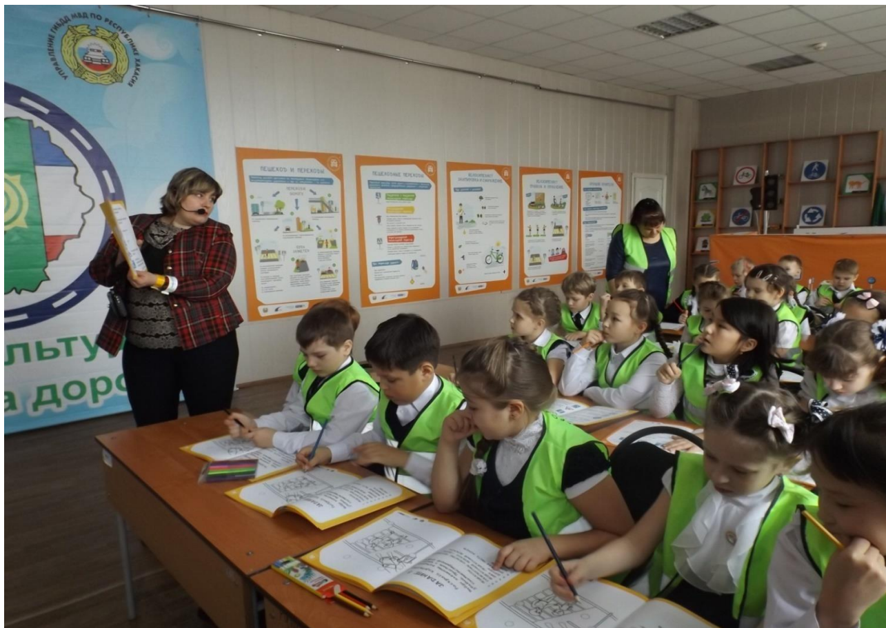
Участие во Всероссийской квест-игре «Безопасная дорога детям»