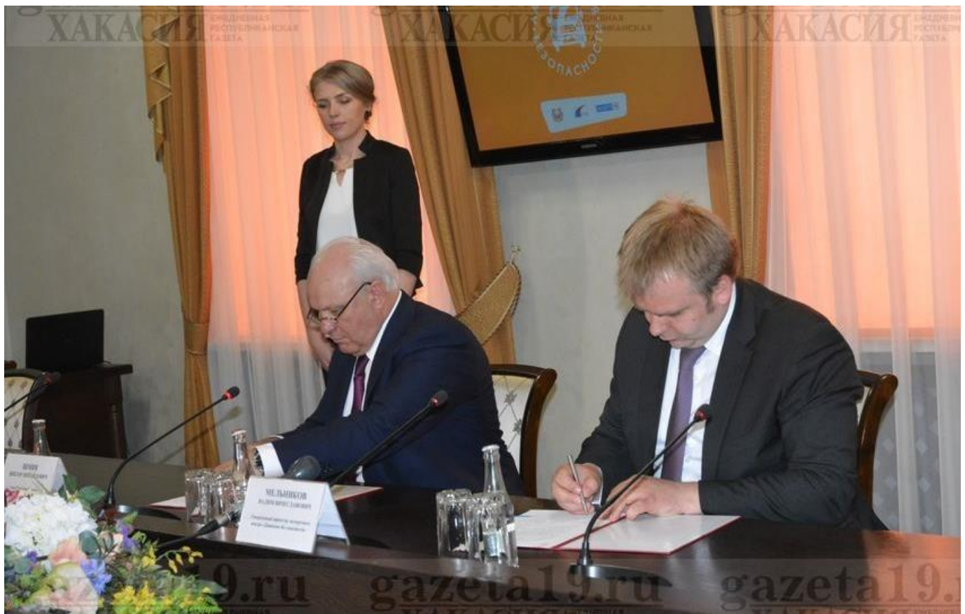
Торжественное разрезание ленточки Зиминым В.М., Главой РХ – Председателем Правительства РХ