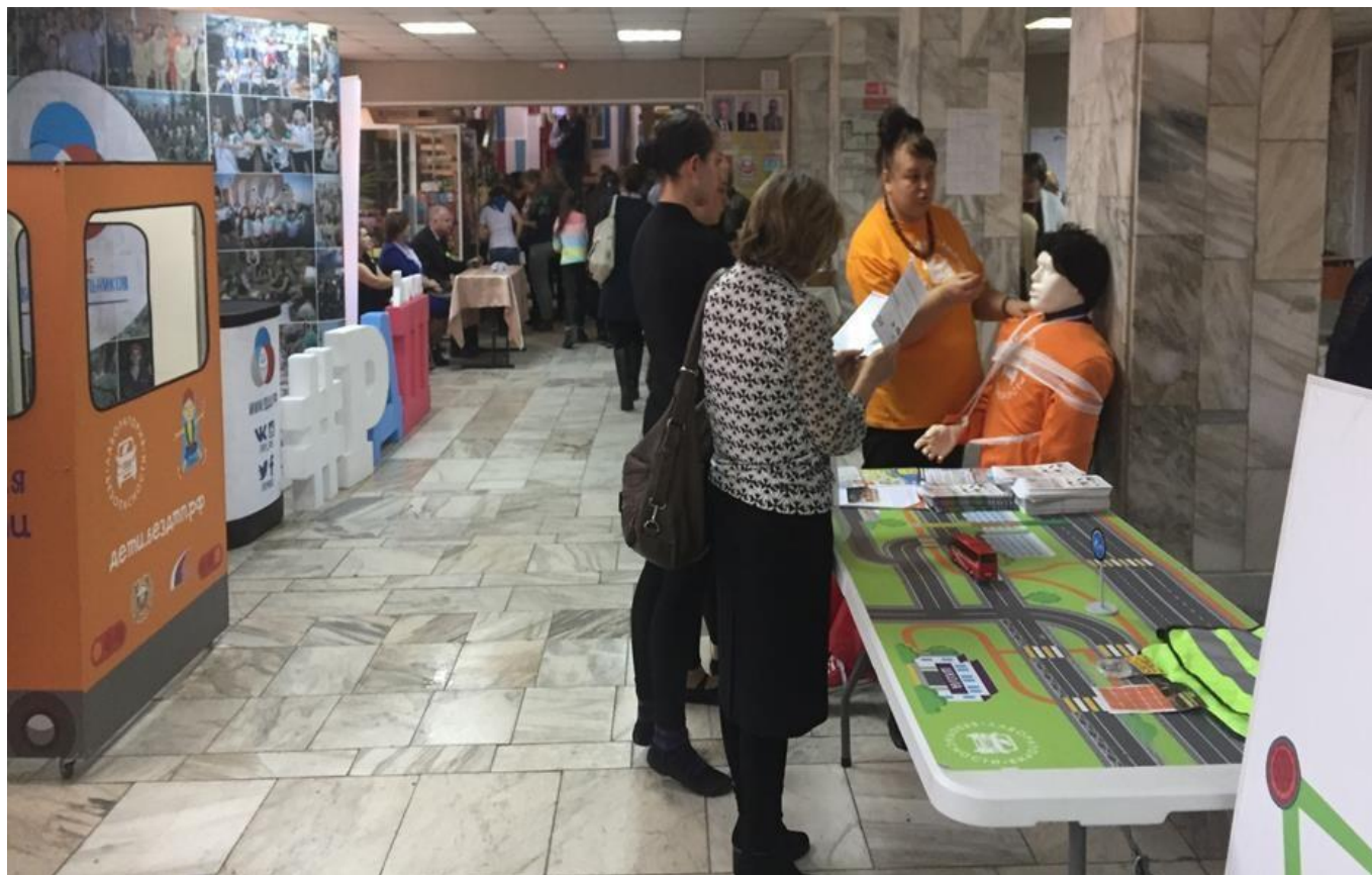
Летняя оздоровительная кампания Центра «Лаборатория безопасности» в загородных лагерях и лагерях дневного пребывания республики