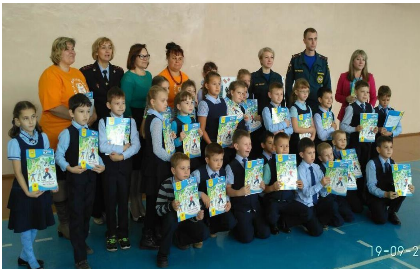
Проведение профилактических мероприятий Центра «Лаборатория безопасности»