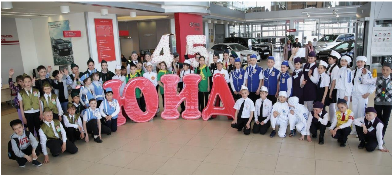
Церемония подписания соглашения Правительства Республики Хакасия и партнёрами программы: Министерство внутренних дел РФ, Экспертный центр «Движение без опасности», ООО «Завод», Российский Союз Автостраховщиков