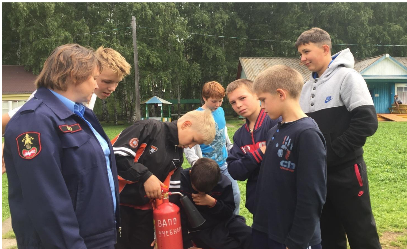
Реализация дополнительной общеобразовательной общеразвивающей программы «Безопасные дороги»