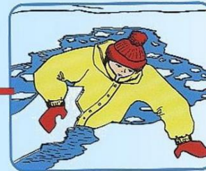
Забросить на лед ногу, откатиться от полыньи