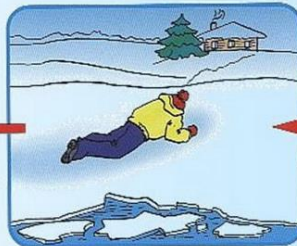
Проползти 3-4 метра по своим следам